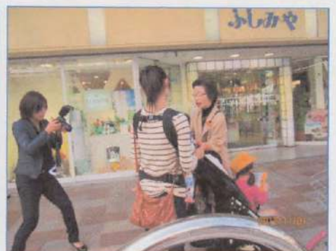
(静岡市呉服町にてリーフレット配布)